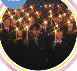
キャンドルサービス