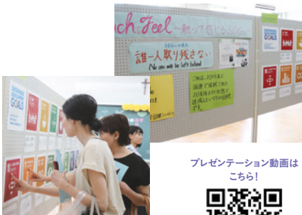
プレゼンテーション動画はこちら!

点訳部は、SDGsの17のゴールとアイコンの解説を点字訳したパネルを制作し、2019年度の文化祭で展示しました。当日は、愛知県立岡崎盲学校の生徒のみならずも来校して展示作品に触れていただき、交流を行いました。「誰一人取り残さない」というSDGsの理念と本校の教育理念とがクロスし、ひとつのカタチとなった企画となりました。