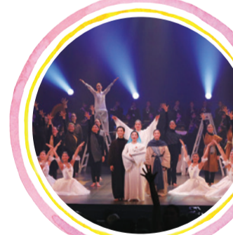
クリスマスページェント