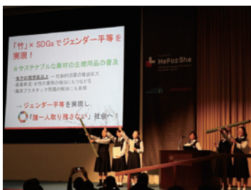
プレゼンテーション動画はこちら!

する視点で提案しました。このアイデアが高く評価され「全国代表校」として、2019年10月に国連大学の国際会議場でプレゼンテーションする機会をいただきました。